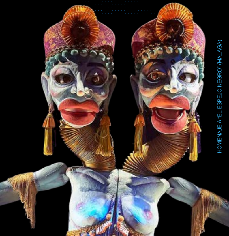
HOMENAJE A "EL ESPEJO NEGRO" (MÁLAGA)